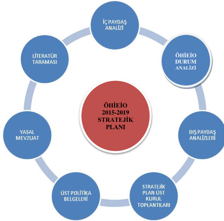
Şekil 2: Stratejik Plan Hazırlık Çalışmaları